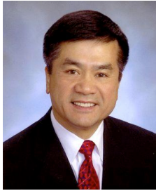
Le secrétaire au Commerce, Gary Locke

américaines incitent aussi l'Administration Obama à y concentrer ses efforts d'expansion commerciale en Amérique latine. De plus, l'émergence de la Chine, qui supporte cette forte croissance par des investissements massifs dans les domaines de l'énergie et des matières premières, ajoute une dimension stratégique au rapprochement. 1