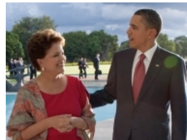
Dilma Rousseff et Barack Obama à son arrivée à Brasília, le 19 mars 2011

La croissance du commerce avec le Brésil, principale économie du Cône sud, est certainement le premier objectif de l'Administration Obama dans la région. L'arrivée d'un nouveau gouvernement depuis janvier, dirigé par Dilma Rousseff, plus ouverte que son prédécesseur, Lula da Silva, au rapprochement avec les États-Unis, facilite ce processus. Le président Obama a profité de sa visite pour mettre en place une commission conjointe sur l'économie et le commerce. La très forte croissance que connaît le pays, plus de 8 % en 2010, et un fort potentiel de croissance des exportations