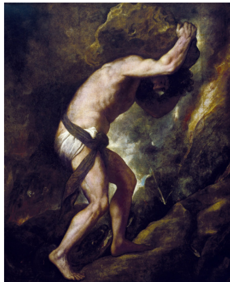
Sisyphe par Titien, 1549, Museo del Prado 1

Résumé : Beaucoup de pays développés roulent difficilement, et dans la souffrance des peuples, une dette de plus en plus lourde, tel Sisyphe roulant son rocher au sommet d'une montagne, rocher qui redégringolera inévitablement, l'obligeant à reprendre inlassablement sa tâche, pour l'éternité. Sisyphe peut-il échapper à son destin ? Certains au FMI semblent même y croire... mais un tel « happy end » reste très incertain !