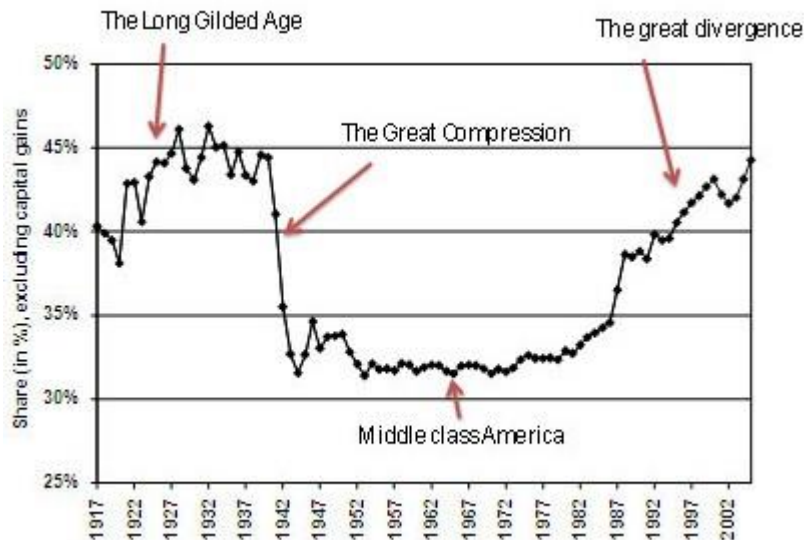
USA, part du revenu national détenue par les 10% les plus riches Pikety et Saez, adapté par Paul Krugman http://contreinfo.info/article.php3?id_article=1261

La théorie économique libérale depuis Adam Smith insiste sur le fait qu'il ne faut pas interférer dans les mécanismes économiques et qu'à trop vouloir redistribuer pour réduire les inégalités on ne provoque que la misère de l'ensemble du corps social. Mais le graphique ci-dessus doit faire réfléchir : la courbe représente l'évolution dans le temps de la part du revenu national reçue par les 10% les plus riches de la population américaine : de l'ordre de 45% avant la crise des années 30 ; la sortie de crise va de pair avec une diminution vers 30% ; cette part se maintient pendant les 30 Glorieuses ; cette part augmente à nouveau dans les années 80, comme par hasard sous l'ère Reagan, pour atteindre au début des années 2000 le même niveau que dans années 1920. De là à induire que l'histoire se répète... Et les masses américaines, faute de revenus, n'ont pu maintenir leur niveau de consommation dans les 20 dernières années qu'au prix d'un endettement considérable dont on voit aujourd'hui le résultat dans l'effondrement de la bulle de crédits.