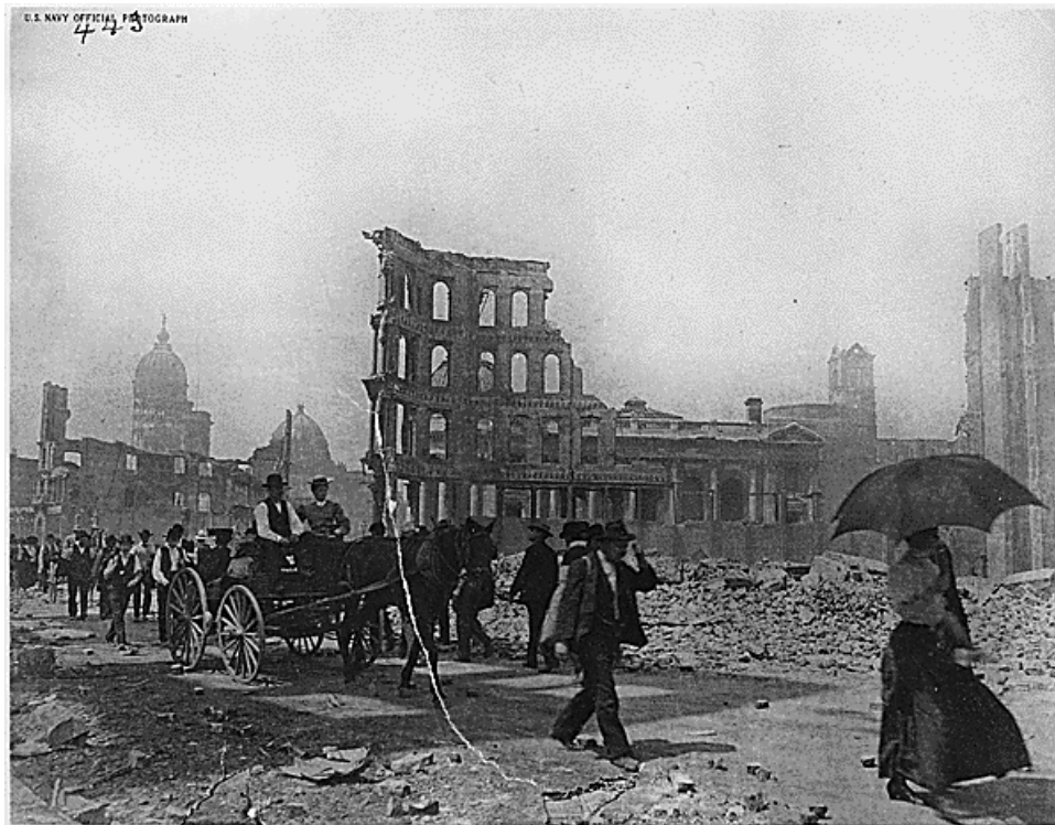
Landscape photograph of San Francisco during the Earthquake and Fire of 1906